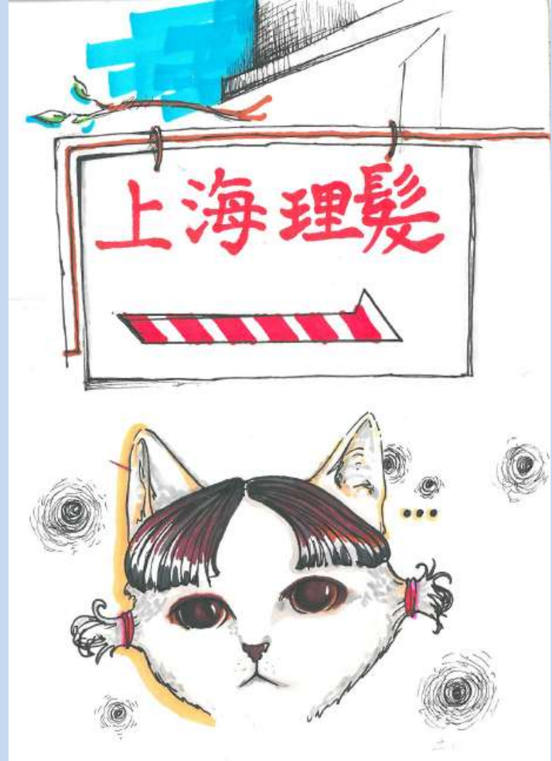
同學作品： 舊區、小店、老街坊