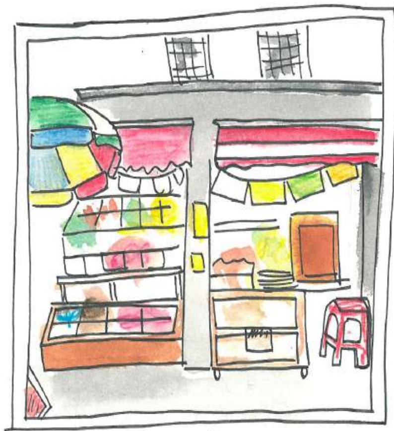
-天秀墟中的一小铺-