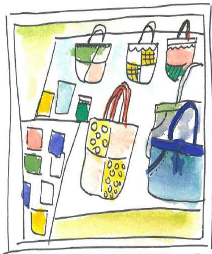
*墟中的一个手作衣架地摊*